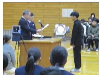
新2役、応援団長任命式（12/23）