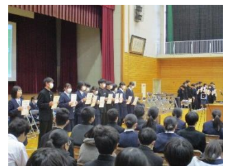
新専門委員長、本部役員委嘱式（12/23）