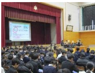
生徒総会（12/23） 活発な意見交換でした

自分で変えることができる未来は、プラスの方向に大いに変えていきたいものですね。 全校生徒の皆さんとご家庭にとって、良い年になるよう心から祈念しています。