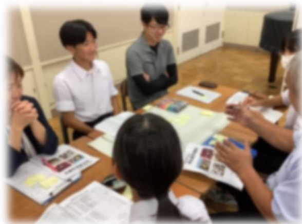
CS委員と生徒のファシリテーション