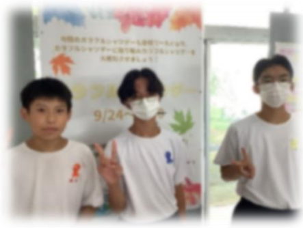
Colorful Shirts Dayの様子